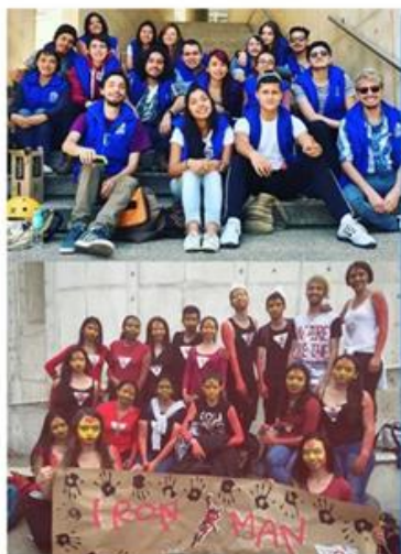
Nuestro Equipo de Inductores